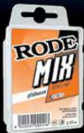
RODE MIX: eccellenti prestazioni, ampio range di temperatura.